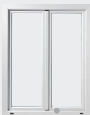
SIGURANȚĂ DE BAZĂ