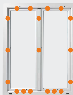
WK 2 – GRADUL 2 DE SIGURANȚĂ