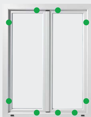
WK 1 – GRADUL 1 DE SIGURANȚĂ